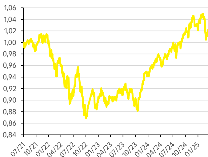
Vývoj hodnoty fondu Strategy 30 EUR